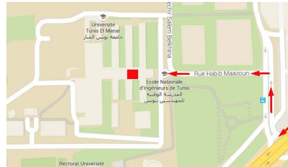
accès à l'amphithéâtre